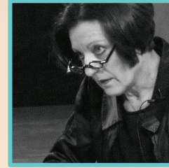
Herta Müller Literaturnobelpreis- trägerin