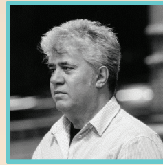
Pedro Almodóvar Regisseur