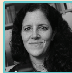
Laura Poitras Regisseurin Oscarpreisträgerin