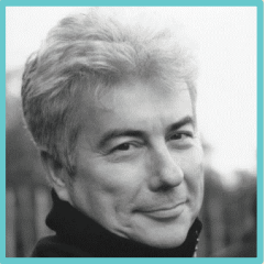
Ken Follett Bestsellerautor

Faszinierende Sprecher auf Voice Republic