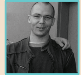
Jonathan Blow Spieleentwickler