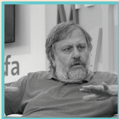
Slavoj Žižek Philosoph