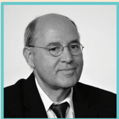
Gregor Gysi Politiker