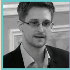
Edward Snowden Whistleblower